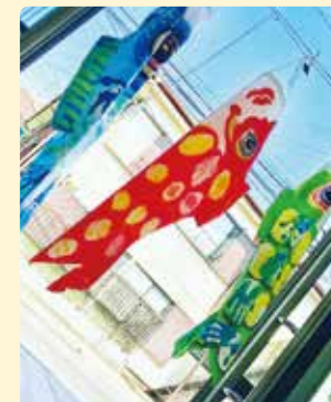
ご本人の「やりたい」を叶えるために各種イベント・アクティビティを実施します。