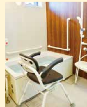
プライバシー保護のため個室と個室のトイレを用意しています。