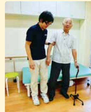
ひとりひとりに個別でリハビリを行います。