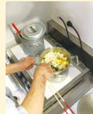
自宅に近い環境で生活や家事の練習を行います。